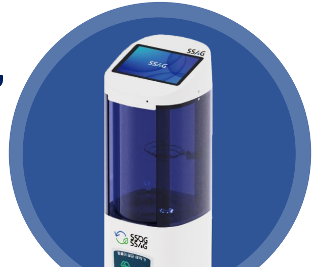
[SSAG] 자동 살균 텀블러 세척기

SSOG [쓱]으로 일회용컵 재활용하고 SS/AG [쓱]으로 텀블러 살균세척하여 재사용 문화를 만들어 가요!