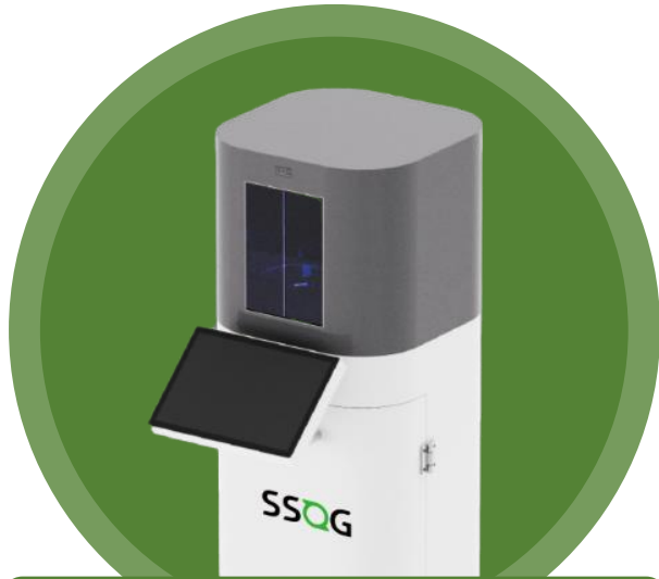
[SSOG] 일회용컵 무인 회수기